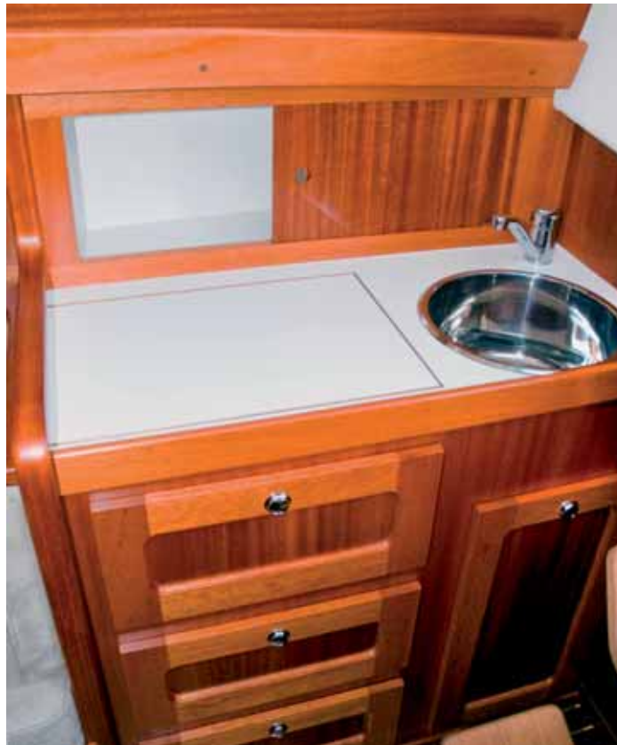
Alles, was man braucht, bietet die kleine Pantry. Der Kocher kommt unter die Platte und wird seitlich herausgezogen.