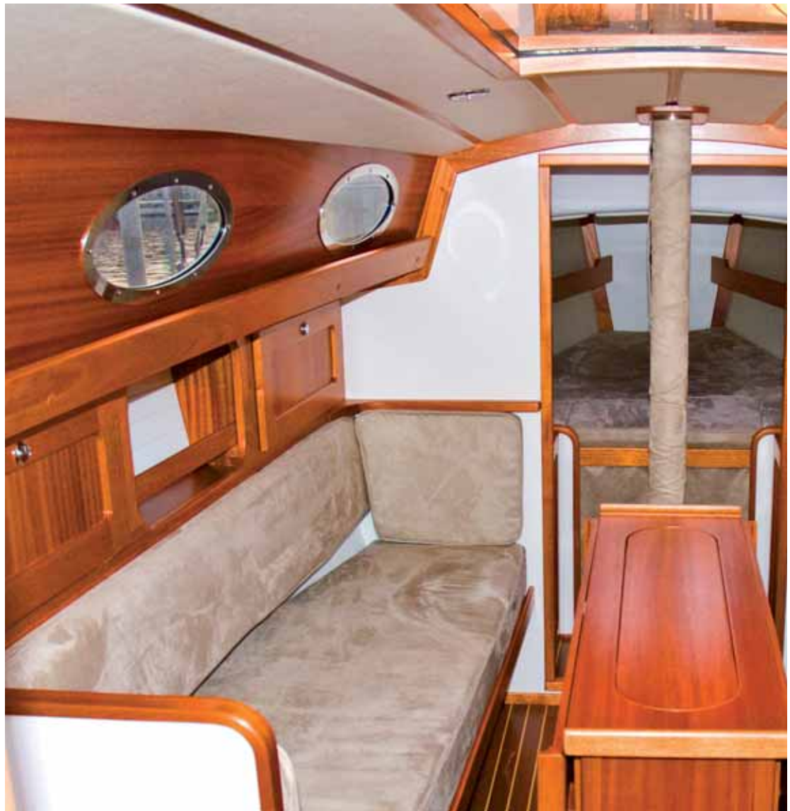
Die Clarc 33 ist wohnlich ausgebaut. Mithilfe der Rückenlehnen lassen sich die Längssitze in Kojen verwandeln. Viel Li

Die Clarc 33 springt sehr gut an, beschleunigt rasant, bleibt dann aber bei knapp über fünf bis sechs Knoten hängen, weil ihr, bedingt durch den Segelschnitt, die Power aus dem oberen Teil