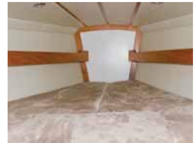
Die lange Vorschiffskoje ist vorn nur knapp 60 Zentimeter breit.