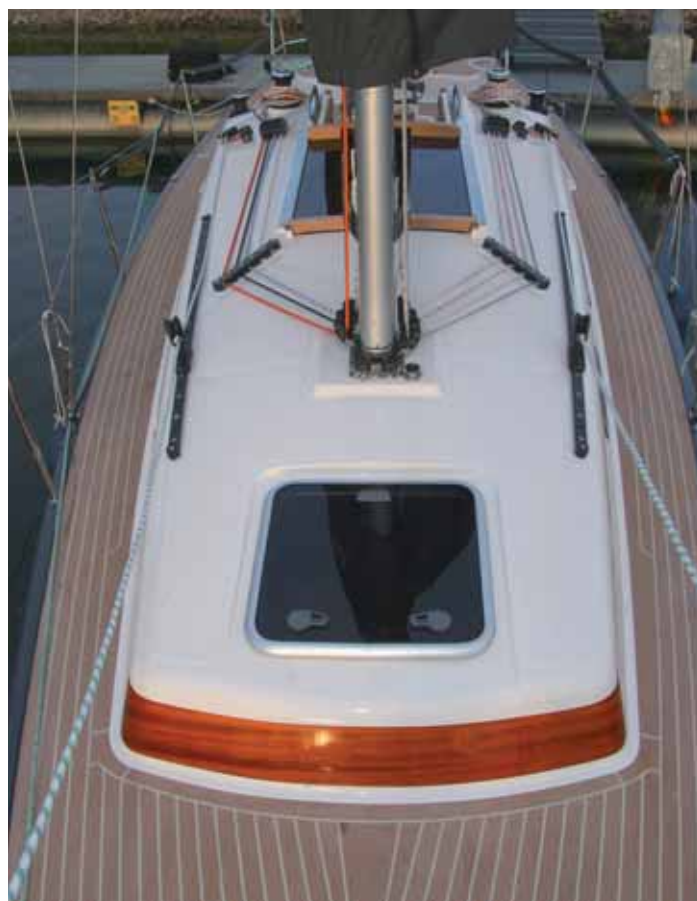
Der Aufbau besteht aus GfK. Die Seitenteile sind furniert und können auf Wunsch auch in anderen Ausführungen geliefert werden. Der Decksbelag besteht aus Kunststoff in Teakdeck-Optik.