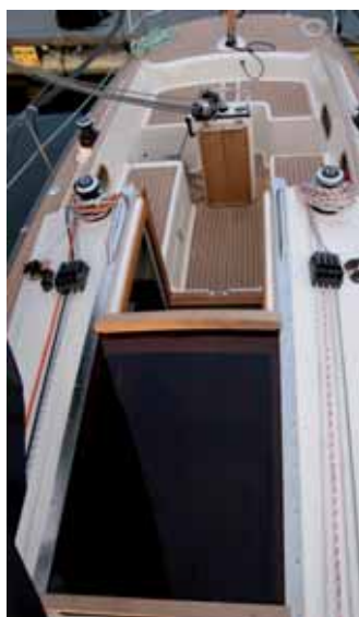
Hier kommt viel Licht unter Deck: Sowohl das Schiebeluk als auch das Dach des Aufbaus bestehen aus Plexiglas.