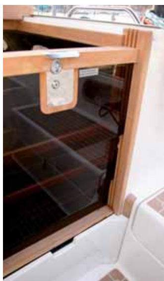
Schönes Detail: Das Steckschott besteht aus mehreren Segmenten und verschwindet bei Nichtgebrauch im Brückendeck.

Der Motor mit 15 PS ist leicht und preisgünstig. Wahlweise kann auch ein Dieselmotor oder ein E-Antrieb eingebaut werden.