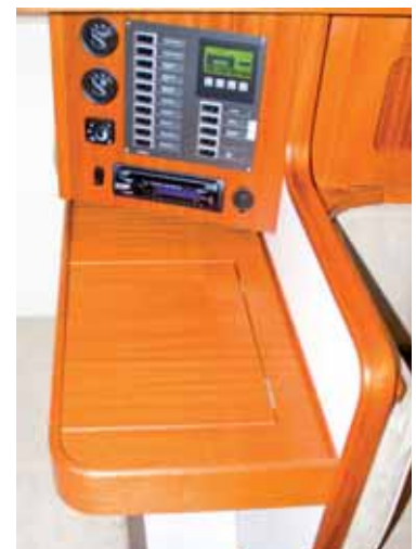
Die kleine Naviecke.