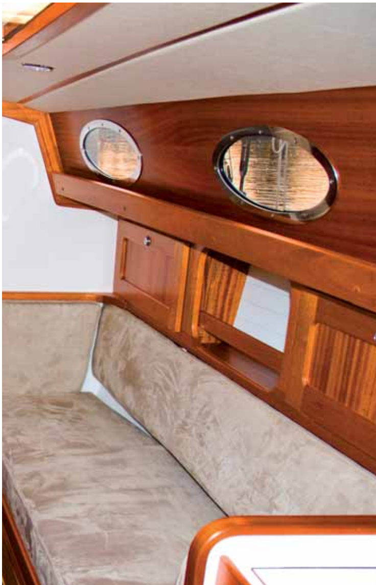
Das Skylight im Kajütdach.