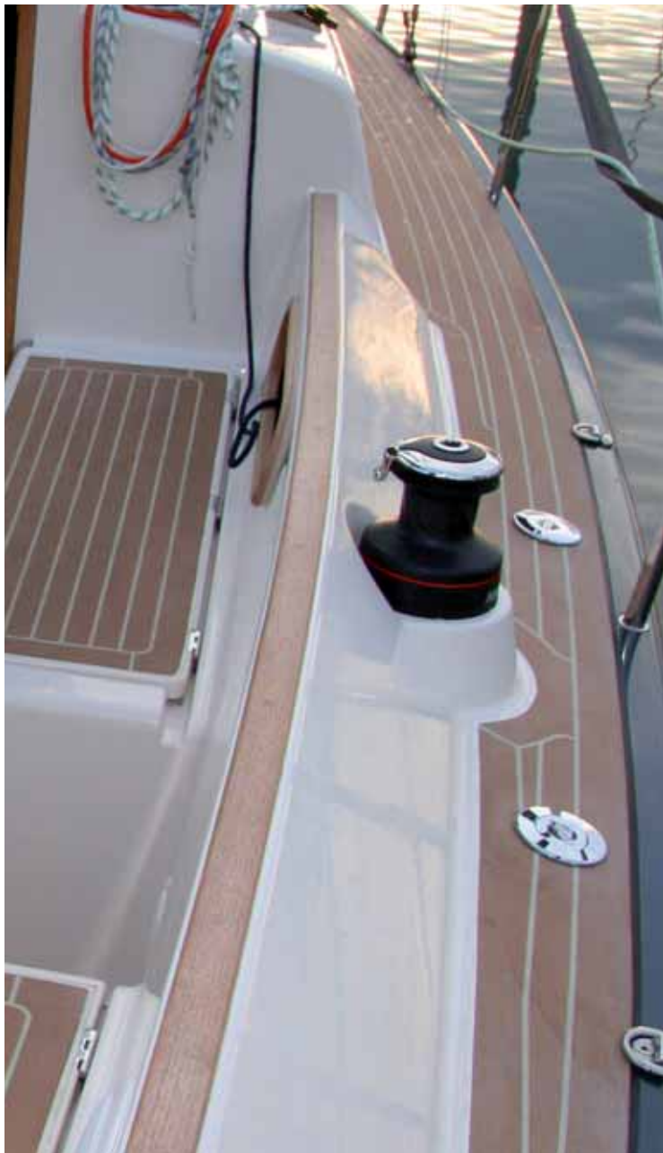
Das optionale Cockpitpodest der Baunummer eins ist Geschmackssache. Am Bodensee kann man auf den Bildschirm im Cockpit verzichten und ist mit einem breiten Traveller besser bedient.